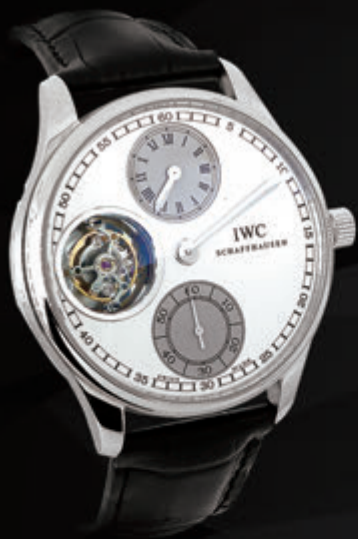
J33827 IWC [萬國] 葡萄牙系列 PT950 43x43mm 手上鍊 陀飛輪 副廠皮帶 新錶定價約 2,630,000元 流當特價:850,000元