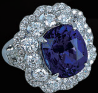
YC050302 天然藍寶戒指 11.43CT GRS證 Royal Blue (H) 斯里蘭卡 參考市價約 7,500,000元 流當特價:2,380,000元