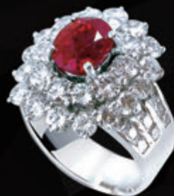
F18341-2 天然紅寶戒指 3.03CT GRS證 鴿血紅 緬甸