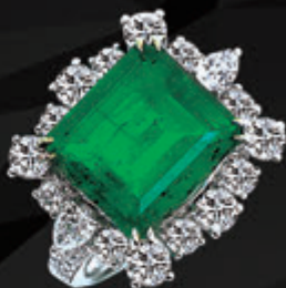
A71519-2 天然祖母綠戒指 6.43CT GRS證 哥倫比亞