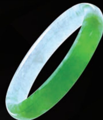
J30906 天然翡翠手鐲 A貨 #18.5 證書