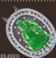
P0578-9 墜 A貨 證書 參考市價 1,100,000元 會場特價 250,000元