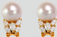
A70631-16 天然珍珠耳飾 9.10mm 參考市價 70,000元 會場特價 25,000元