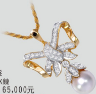
B41488-10 天然珍珠墜 8.82mm 18K鍊 參考市價 65,000元 會場特價 18,000元