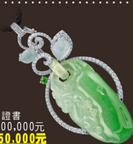
E41493-1 墜 A貨 鑽線繩 證書 參考市價 1,000,000元 會場特價 250,000元