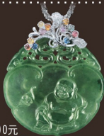
Q36376-5 墜 A貨 14K鍊 證書 參考市價 700,000元 會場特價 120,000元