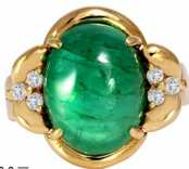
F31309-2 天然祖母綠戒指 6.03CT 參考市價 80,000元 會場特價 25,000元