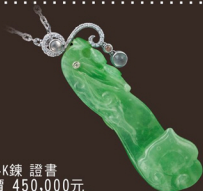
K2019-4 墜 A貨 14K鍊 證書 參考市價 450,000元 會場特價 88,000元