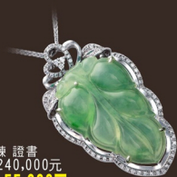
MY060106-5 墜 A貨 18K鍊 證書 參考市價 240,000元 會場特價 55,000元