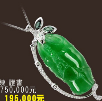
R4272-1 墜 A貨 18K鍊 證書 參考市價 750,000元 會場特價 195,000元