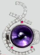
R5679-2 天然水晶戒指 8.19CT 參考市價 80,000元 會場特價 28,000元