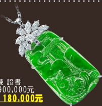
R3356-2-1 墜 A貨 14K鍊 證書 參考市價 900,000元 會場特價 180,000元